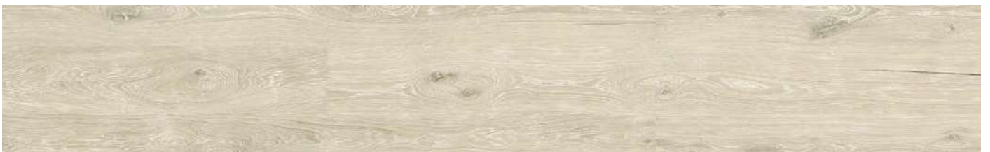
ADG1001 Washed Arcaine Oak 80000122