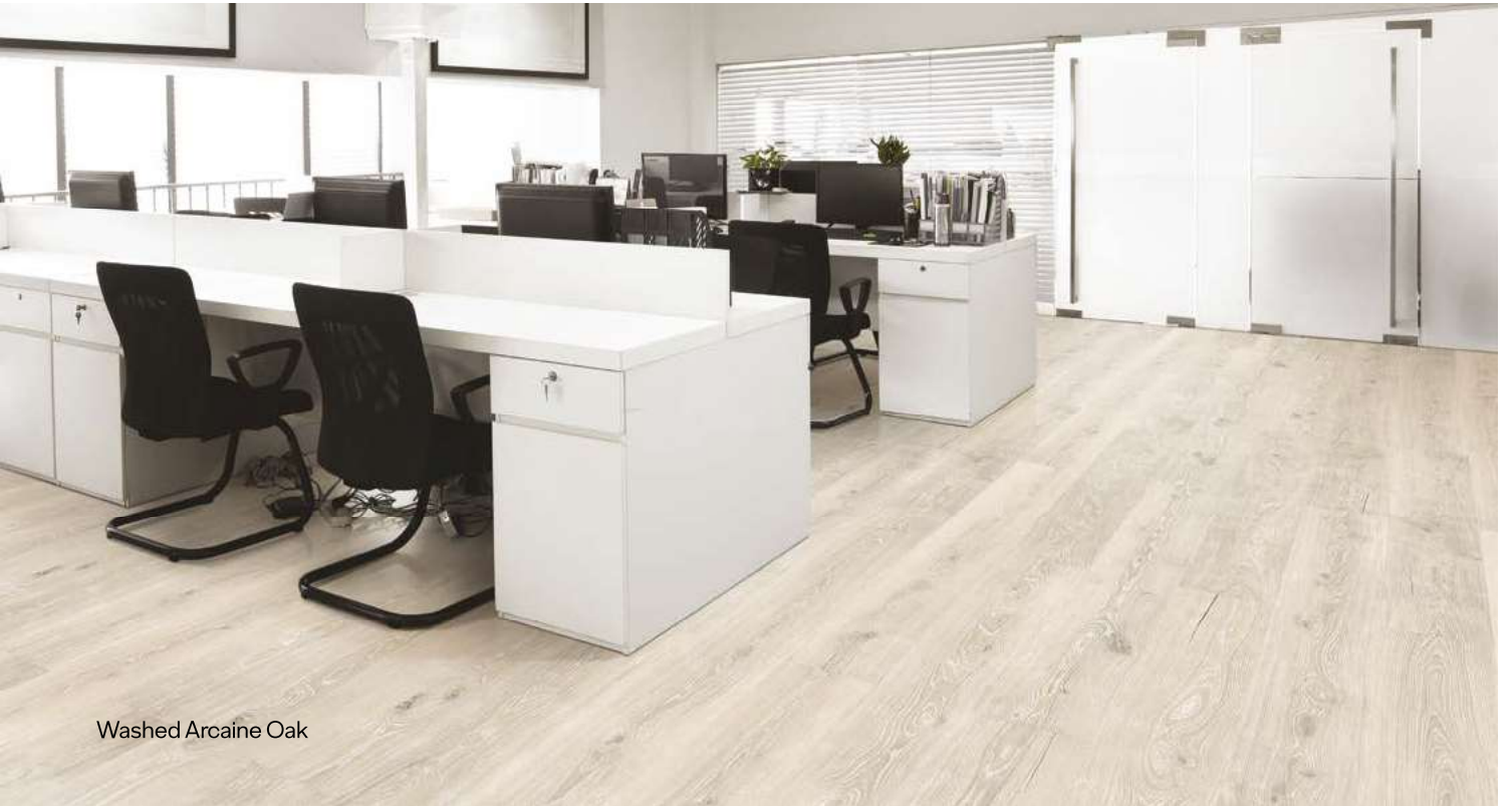
Washed Arcaine Oak