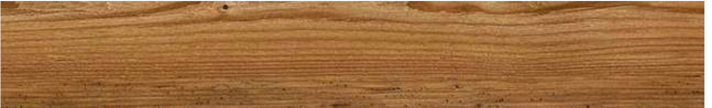
AEYB001 Sprucewood 80000167