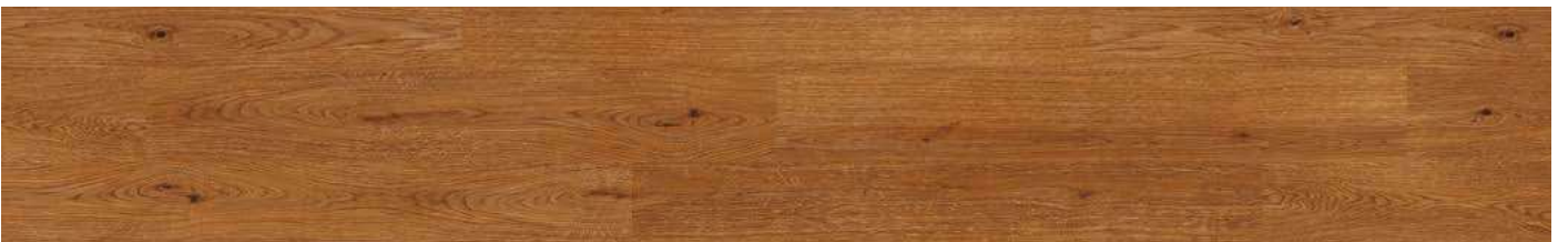
AEUU001 Chocolate Brown Oak 80000163