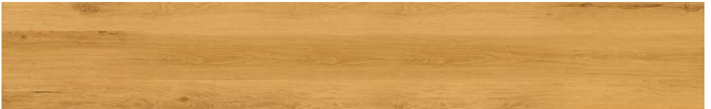
ADF7001 Golden Prime Oak 80000118