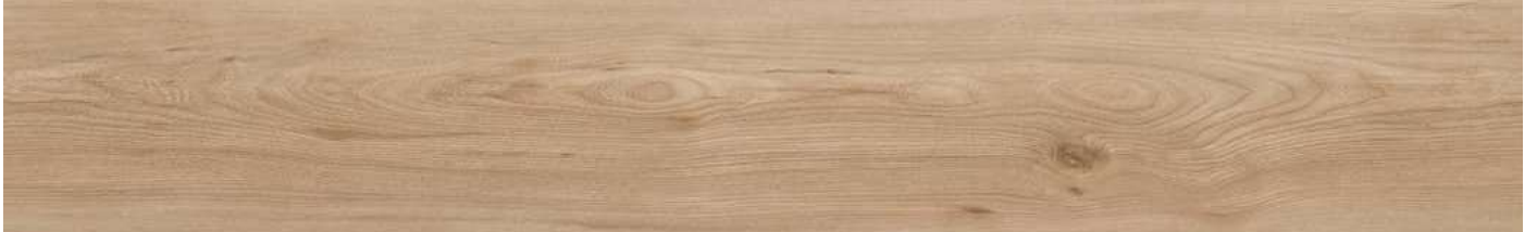
AEYJ001 Cyber Oak 80000174