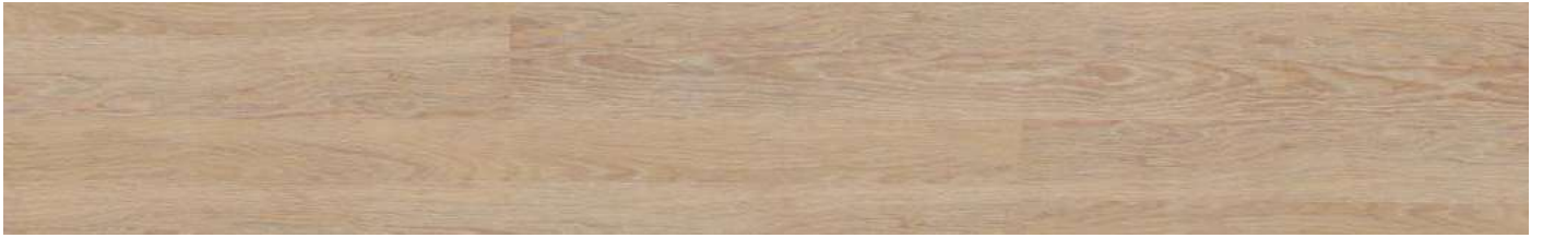
AEUC001 Contempo Rust 80000154