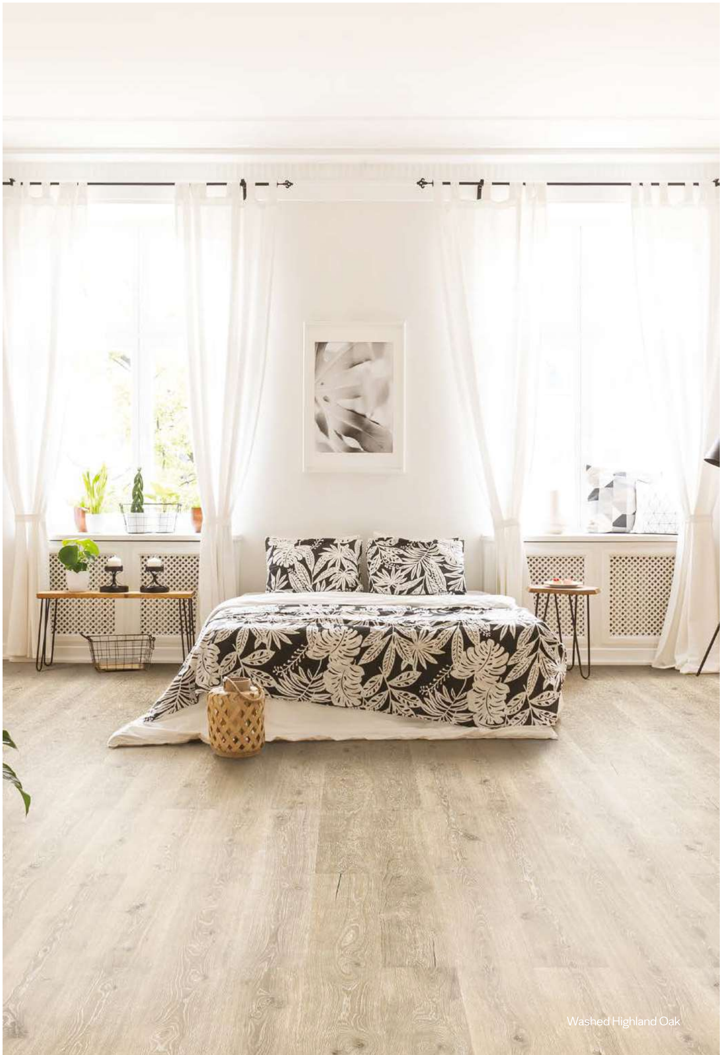
Washed Highland Oak