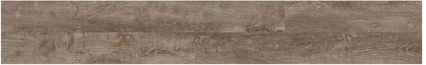
AEUP001 Treehouse 80000158