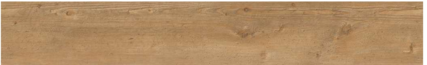
AEYA001 Mountain Oak 80000166