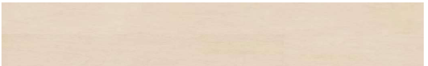
AEUD001 Contempo Ivory 80000155