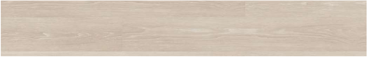
ADF4001 Classic Prime Oak 80000115