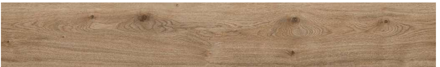
AEYG001 Field Oak 80000172