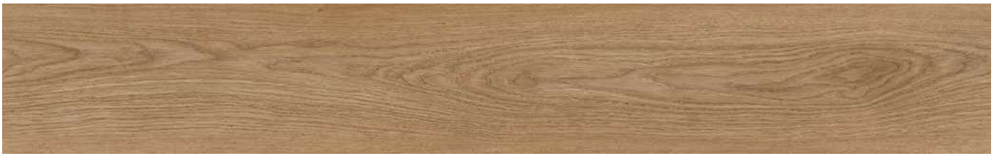
AEYE001 Manor Oak 80000170