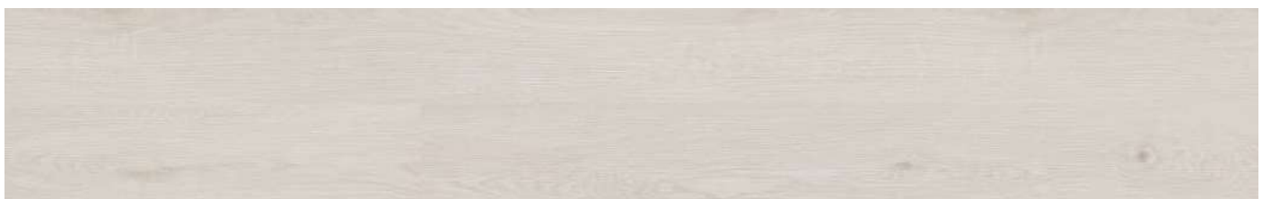
AEUS001 White Forest Oak 80000161