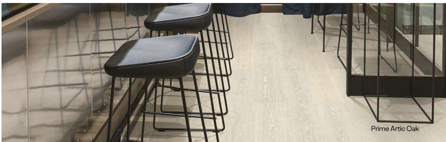
Prime Artic Oak