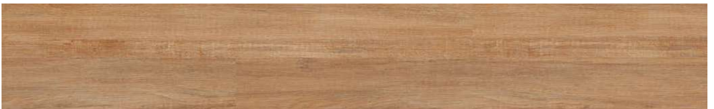
AEUB001 Contempo Copper 80000153