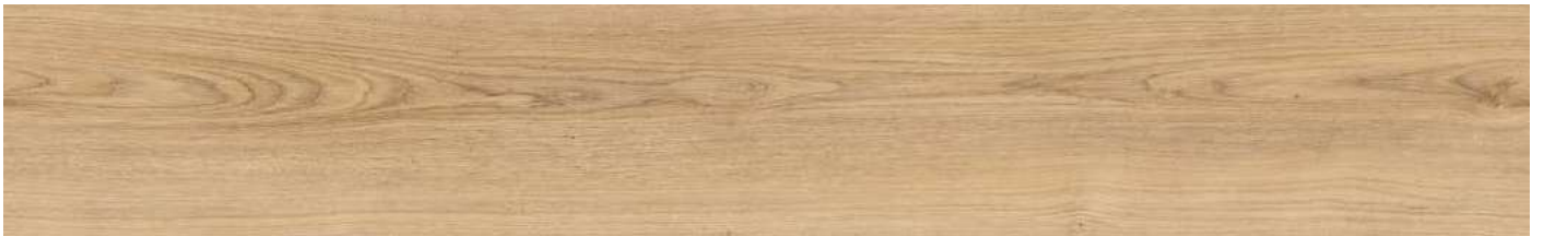
AEYD001 Royal Oak 80000169