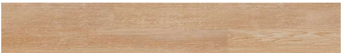
AEUM001 Natural Light Oak 80000157