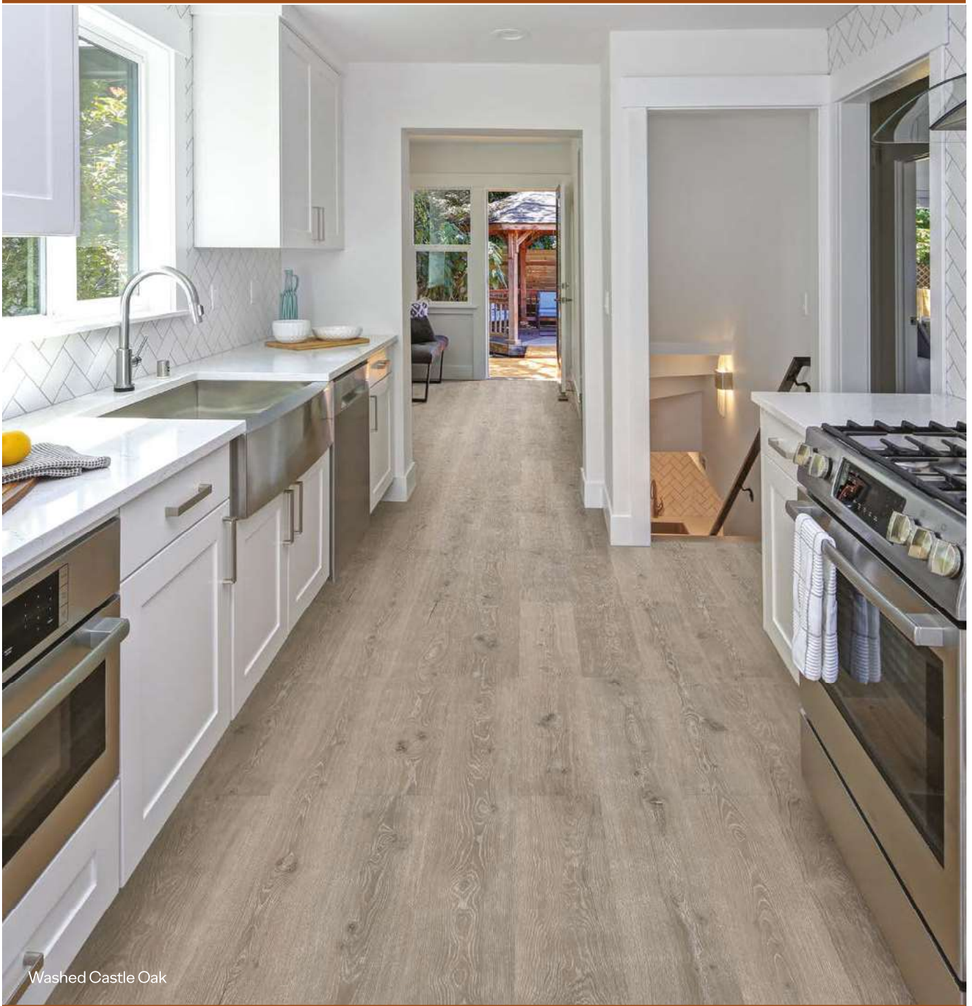
Washed Castle Oak