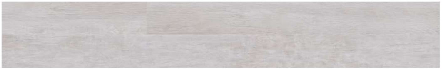
AEUR001 Beach House 80000160