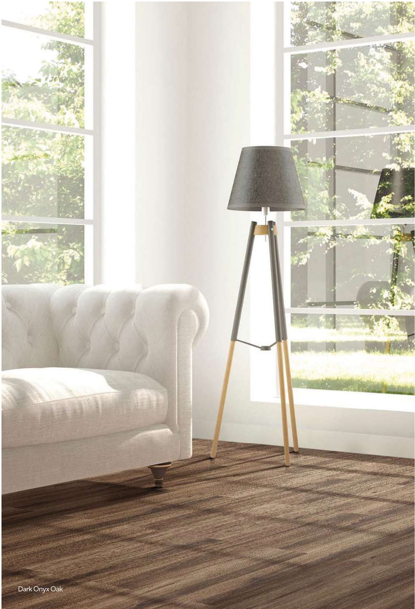
Dark Onyx Oak