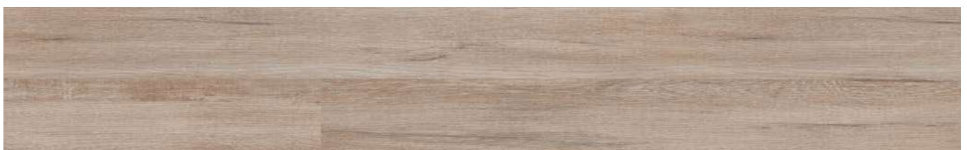
AEUA001 Contempo Loft 80000152