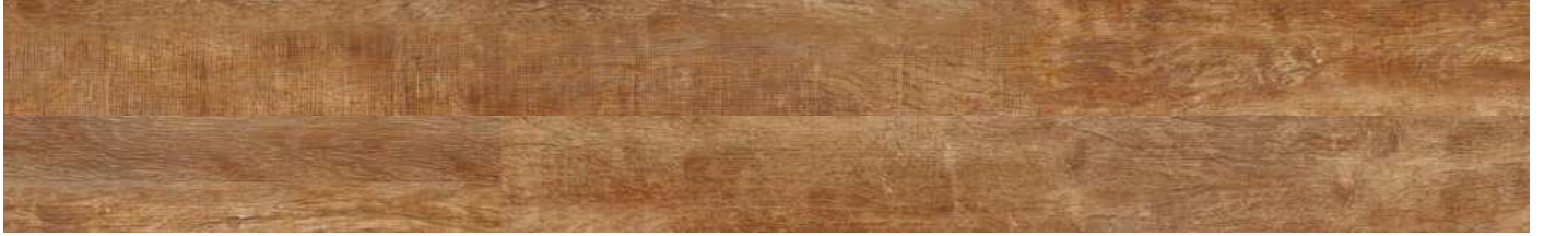
AEUW001 Barnwood 80000165